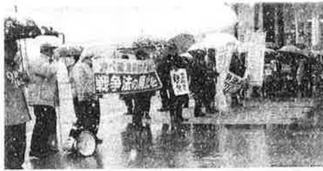
スタンディングで戦争法の廃止を呼びかける人たち。19日、富山市

富山県では、「戦争する国」づくり反対共同行動実行委員会が富山駅前で戦争法の廃止を訴えるスタンディング宣伝をしました。県平和運動センター、安保廃棄実行委員会、