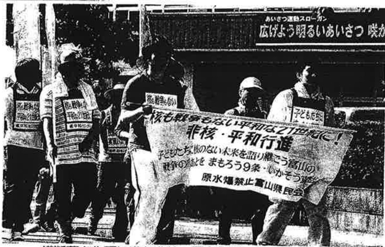
横断幕を先頭に進む非核・平和行進＝高岡市広小路で