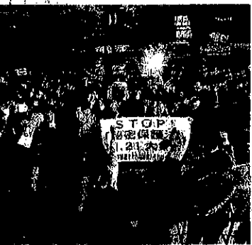
「秘密保護法」を廃案に追い込むため、がんばろうと唱和する11・21大集会の参加者。国会へのデモは夜10時半ごろまで続きました=21日、衆院議院前

逮捕状にも捜査手帳にも、犯した罪が書かれませ ぬ。何の罪の疑いがかける ているか、その核心が秘 密だからです。 起訴状にも犯した罪の内 容が書かれない。これで はどうして訴えられたのか が本人にもわからず、裁判 場でも弁明のしようがあり ません。