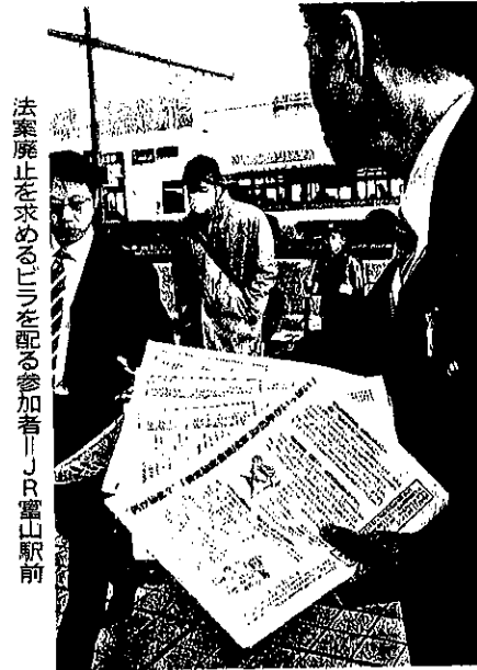
法案廃止を求めるデモを配る参加者 JR富山駅前

特定秘密保護法案の成立に 反対し、民主主義を守る運動 に反対し、民主主義を守る運動 反対訴え ビラ配り